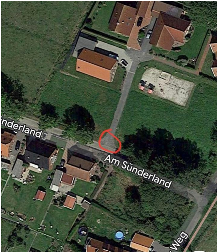
Bild: Ortsangabe Hatzum