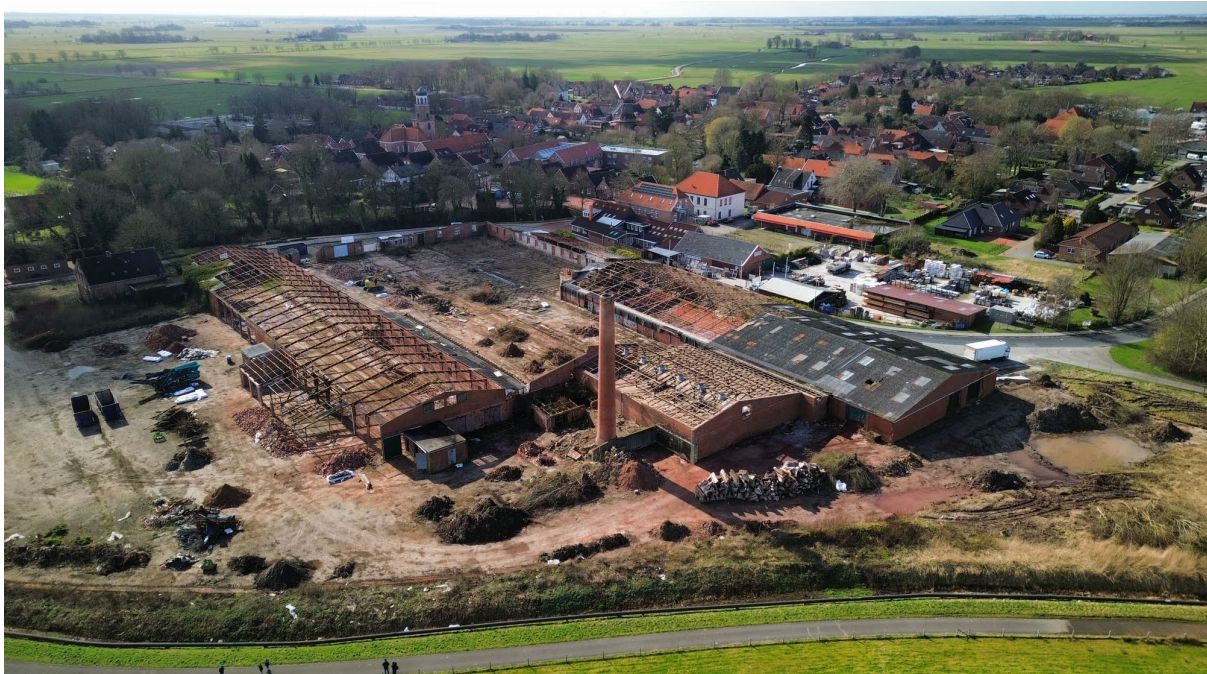
Abb. 1: Blick auf das Areal der ehemaligen Ziegelei Reins während der Abbrucharbeiten.

Besondere gestalterische Aufmerksamkeit gilt dem Bereich des alten Hafens am Jemgumer Sieltief. Hier ist durch die Gemeinde Jemgum eine großzügige Platzgestaltung vorgesehen, die als identitätsstiftender, öffentlicher Raum die Verbindung zum Wasser stärkt und vielfältige Nutzungen wie Aufenthalt, Begegnung oder temporäre Veranstaltungen ermöglicht. Die Gesamtmaßnahme wird über das Programm „Wachstum und nachhaltige Erneuerung“ des Landes Niedersachsen gefördert.